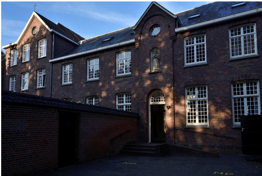
Stadsklooster San Damiano