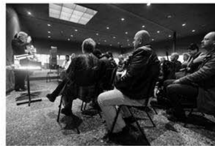
Kerstviering Straatpastoraat | Annakerk – 's-Hertogenbosch