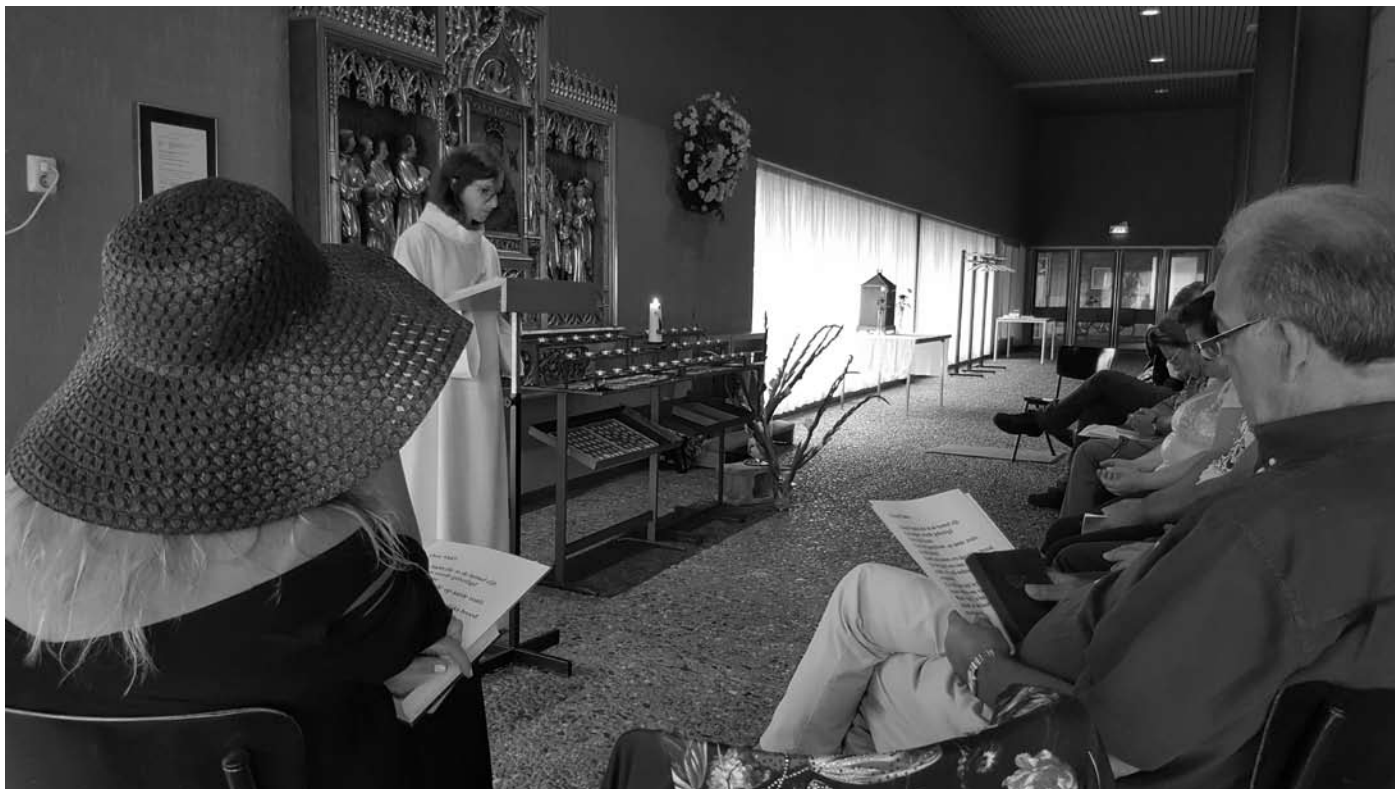
Gebedsviering met de straatpastor op zaterdagmiddag