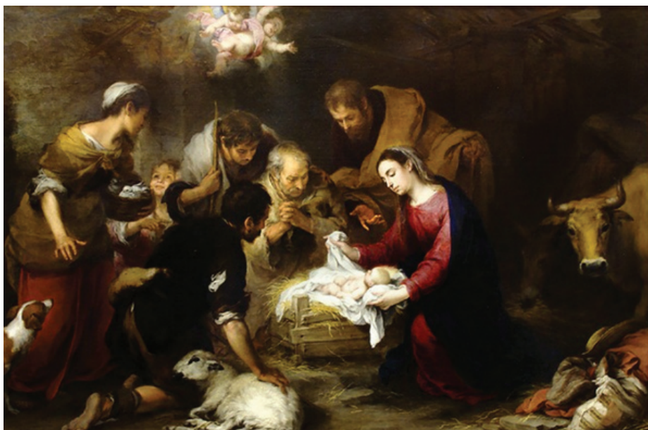
De aanbidding van de herders door de Spaanse schilder Bartolomé Esteban Morillo (1617-1682)

Jezus staat in het centrum van deze kerstscene, letterlijk als stralend middelpunt. Maria, met links van haar Jozef, toont haar pasgeborene baby aan de drie mannen die om de baby heen gegroepeerd staan. Het zijn de herders, wat blijkt uit hun simpele kleding en de staf die een van hen bij zich heeft. Twee van de herders knielen voor het kindje neer. Je kunt hun blote, vieze voeten zien. Deze mannen zijn arm en werken op het land. Ze zijn in aanbidding voor het kind neergeknield. De vrouw links heeft duiven meegebracht: een tradi-