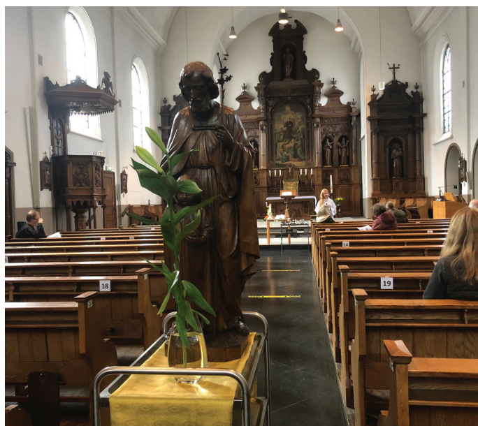
De heilige Jozef in de kloosterkerk