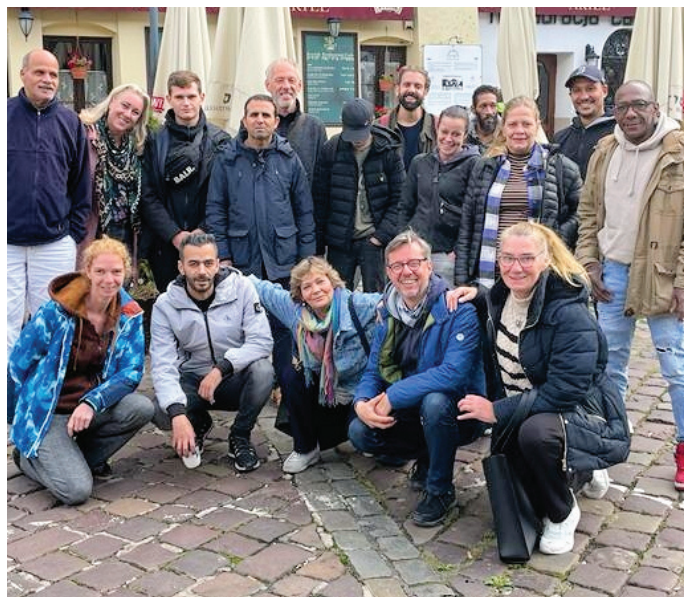
Deelnemers aan de Auschwitz-reis

We kennen allemaal de woorden 'Arbeit macht frei'. We weten dat dit een leugen is. Maar welke woorden zijn wel gepast? Het zien van zo veel verschrikking in dit kamp maakt je stil. Op zo grote schaal hebben mensen geleden. Er zijn geen woorden voor. Een vitrinekast vol met haar waar