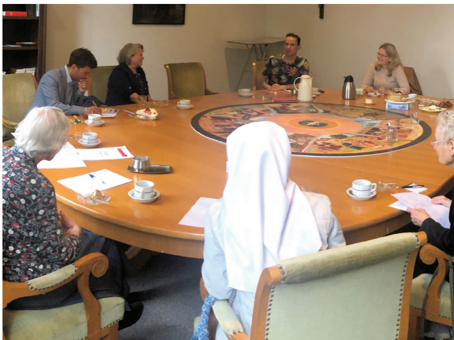
Subsidiënten op bezoek bij het straatpastoraat