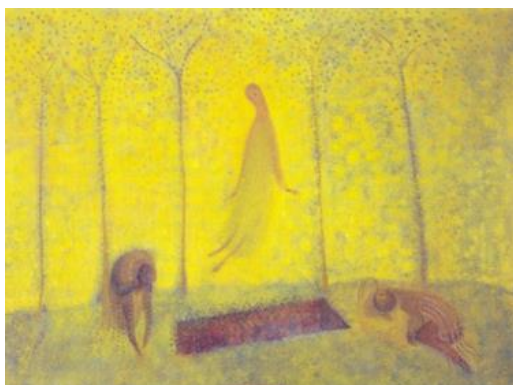
Verrezen Christus. Aad de Haas, kerk Wahlwiller (Limb)

Meer over het Straatpastoraat kunt u vinden op: www.straatpastoraatdb.nl